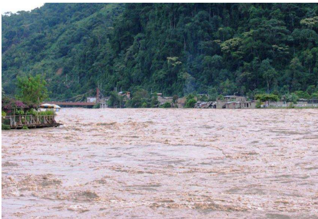
En la columna de fotografías se observa: el RIO CHIRIARI (RIO TSIRIARI) , en sus maximas avenidas, poniendo en zozobra a la población de Tsiriari.