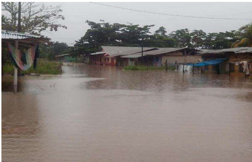
En la columna de fotografías se observa: el desborde del RIO CHIRIARI (RIO TSIRIARI) , afectando a la población del sector Tsiriari.